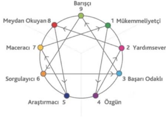
Şekil 2. Enneagram Mizaç Tipleri

kontrol etmeyi birincil plana alma eğilimi taşırlar. Bu özellikler onları korumacılık ve ihtiyaçlarını kendileri karşılamaya güdüler. Barışçı olarak isimlendirilen Mizaç 9'lar, çatışmadan kaçan ve her şeyde orta yolu bulmak isteme eğiliminde olan tiplerdir. Doğrudan öfkelerini göstermek yerine baskılama eğiliminde olurlar. Yüzleşmek onlar için rahatsız edici bir eylemdir. Onun yerine çoğunlukla kaçınan bir tavır sergilerler. Barışçıl halleri, insan ilişkilerinde ara bulma, uzlaştırma gibi konularda başarılı olmasını sağlar (Palmer, 2010).